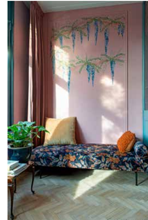
Visgraatvloer Loven Dageraad Vloeren. Muurverf Hellebore 275 van Little Greene. Verf paneel De Nimes van Farrow & Ball. Muurschilderingen zelfgemaakt. Daybed Karwei, geel kussen H&M Home, oranje kussen Jysk. Bijzettafel kringloopwinkel, plantenpot gekregen. Gordijnen Leen Bakker.

"Ik heb een beeld in mijn hoofd – zó moet het worden – en dan begint het zoeken"