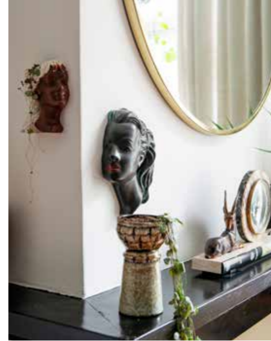
^ Zwart beeld en miniwaas aan muur vintage Cortendorf. Vintage pot met hangplant String of Hearts. Klok met dieren garage verkoop. Spiegel Sissy-Boy.