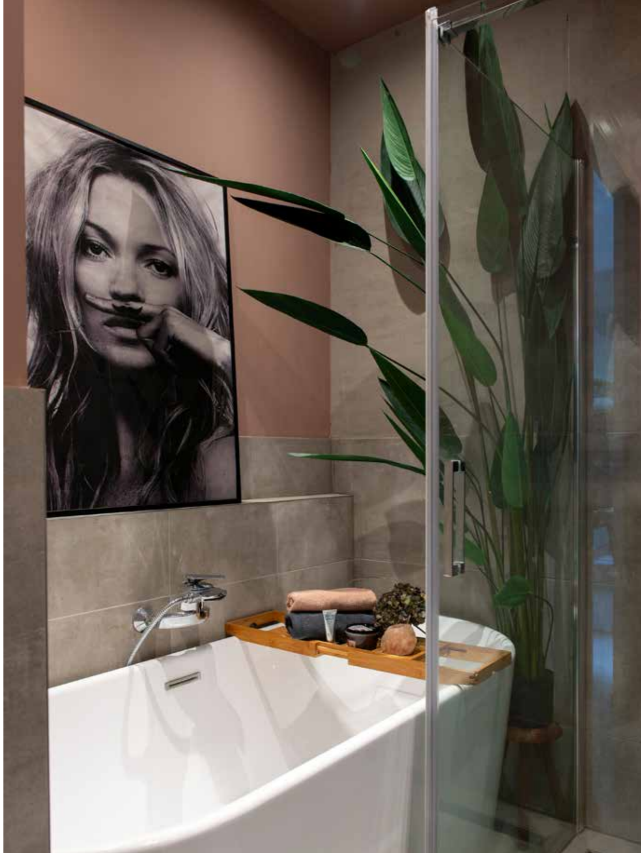
^ Muurverf Sulking Room Pink Modern Emulsion van Farrow & Ball. Bad van een winkel die niet meer bestaat. Herkomst tegels onbekend. Nepplant Strelitzia Tuinland. Badplank Lidl. Badgoed Hema. Lijst met portret Kate Moss Desenio.