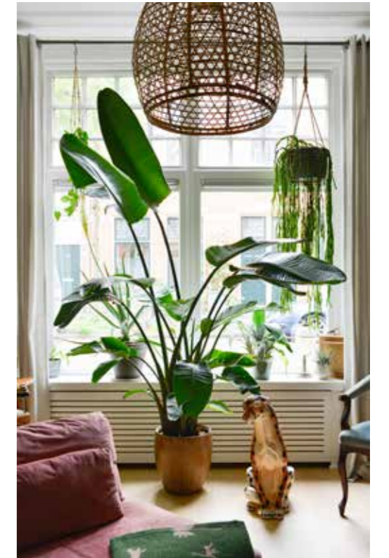
^ Grote plant Strelitzia, pot Hornbach. Beeld cheeta Verkoopfabriek Assen. Bankhoes Norsemaison, groene plaid Sissy-Boy. Fauteuil vintage vondst. De esdoornhouten vloer lag er al. Gordijnen Kwantum. Vintage plafondlamp De Handelsfabriek. Pot met hangplant Lepismium bolivianum Tuinland.