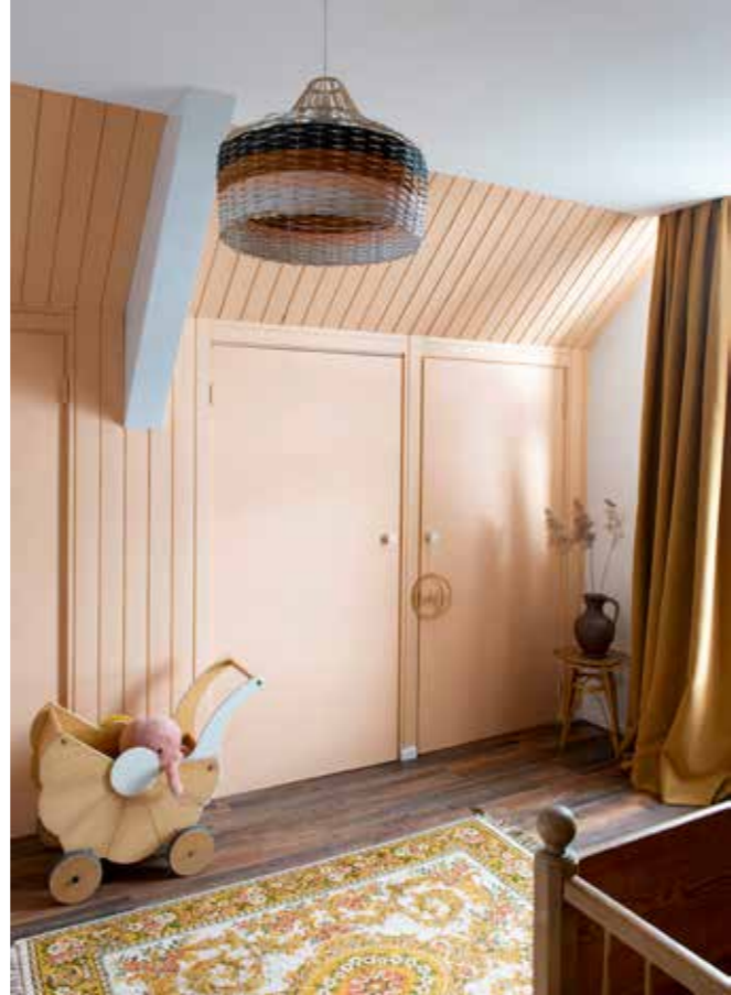
^ Poppenwagen Marktplaats, vloerkleed kringloopwinkel, hanglamp Kwantum. Houten krans met naam Mood Creation. Gordijnen Kwantum. Bijzettafel en vaas vintage vondsten. Vintage ledikant Oprechte Veiling Haarlem.