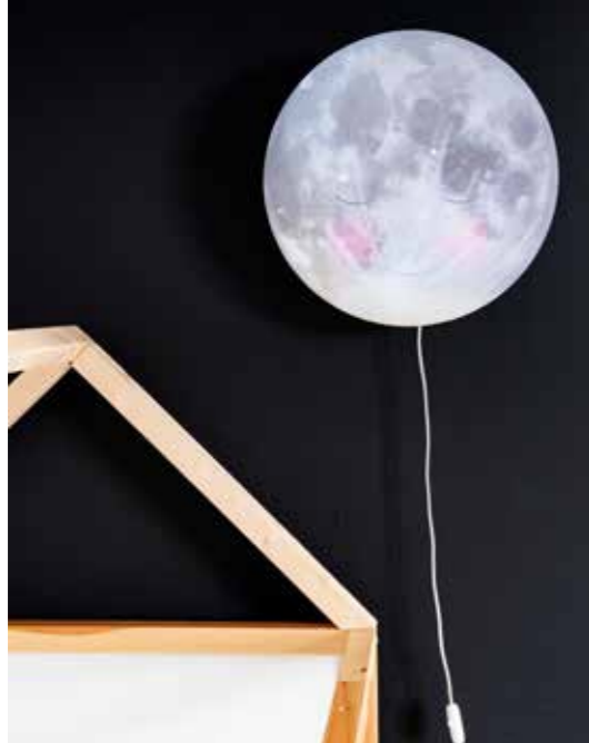
^ Maanlamp Hartendief. Op de muur schoolbordverf.