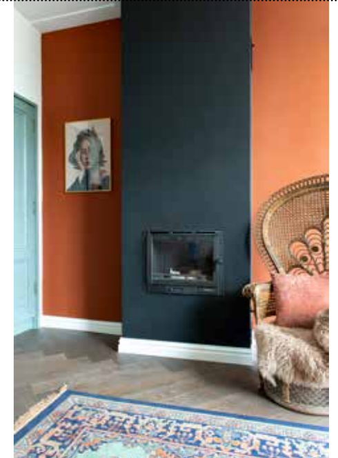
^ Pauwenstoel brocantemarkt Lille, terra kussen House of Nature, vacht Tuincentrum de Oosteinde, vloerkleed Raz Wonen met Lef, poster replica Aykut Aydogdu.