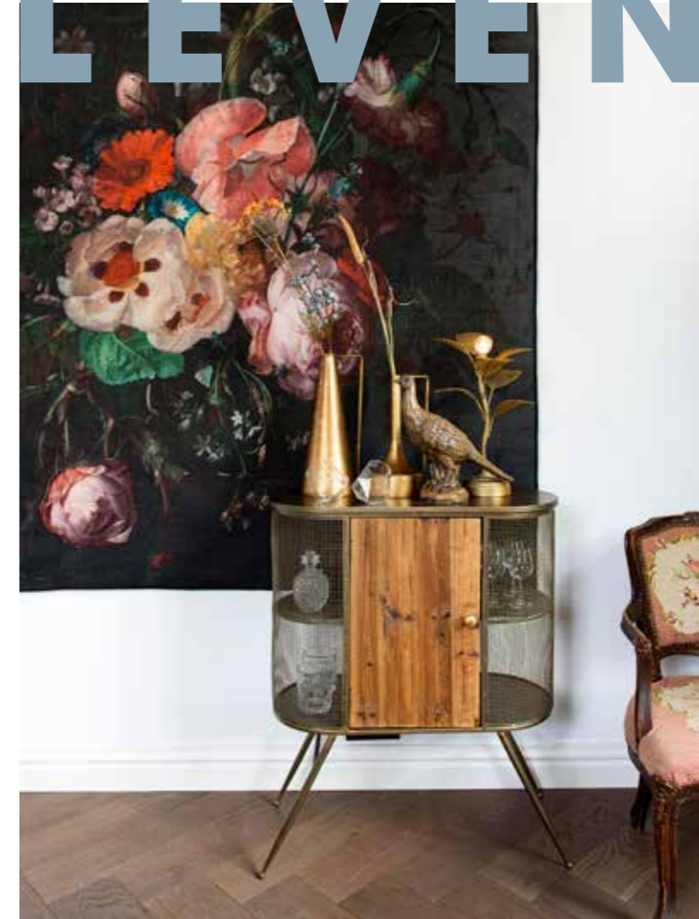
Vloerkleed aan muur Kwantum. Drankkast, vazen, fazant en lamp House of Nature. Whiskyglazen Diamant Thumbs Up. Stoel kringloop.